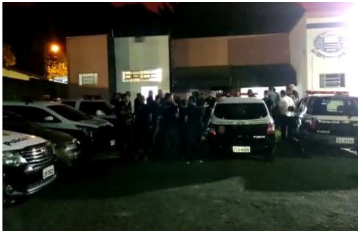
Policiais civis se reúnem antes de operação contra quadrilha especializada em roubo de caminhonetes em Jaguariúna

Cerca de 50 agentes iniciaram a ação em oito endereços por volta das 4h, com apoio das polícias de Serra Negra, Jaguariúna, Pedreira, Santo Antônio de Posse e Mogi Guaçu, além de Bragança Paulista e Atibaia