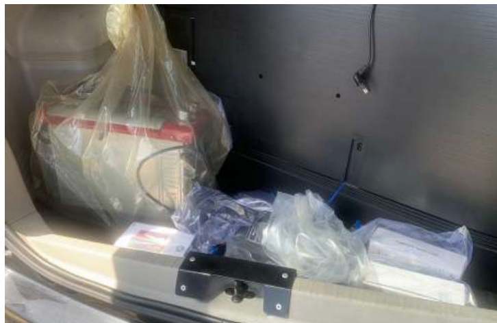
Televisão, forno elétrico e simulacro de arma de fogo foram apreendidos em operação da Polícia Civil de Serra Negra