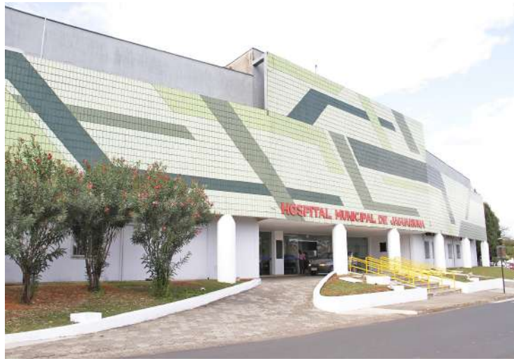
O Hospital Municipal de Jaguariúna, conquistou o Prêmio Paes Leme, con-

O prêmio também é um reconhecimento ao trabalho dos profissionais de saúde do hospital