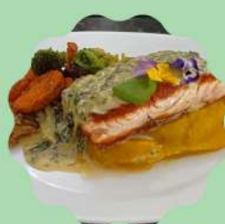
SALMÃO PRIMAVERA COM PURÊ DE MANDIOQUINHA E MOLHO ESPECIAL