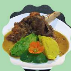
LAMSBOUT À MODA TRATTORIA

Horário de funcionamento Segunda a quinta feira das 11:30 às 15:30 Sexta feira a domingo e feriados das 11:30 às 16:00 hrs