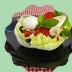
CONCHA DE ALFACE AMERICANA COM FARFALE, PALMITO, TOMATE SECO E MIX DE LEGUMES

Venha conhecer nosso cardápio especial da Primavera!