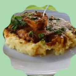
SCHENKEL: OSSOBUCO À SOUS-VIDE E PURÊ DE BATATA