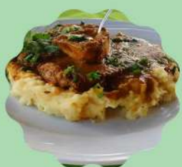
SCHENKEL: OSSOBUCO À SOUS-VIDE E PURÊ DE BATATA