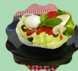
CONCHA DE ALFACE AMERICANA COM FARFALE, PALMITO, TOMATE SECO E MIX DE LEGUMES

Venha conhecer nosso cardápio especial da Primavera!