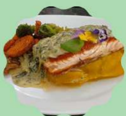
SALMÃO PRIMAVERA COM PURÊ DE MANDIOQUINHA E MOLHO ESPECIAL