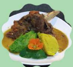
LAMSBOU À MODA TRATTORIA

Horário de funcionamento Segunda a quinta-feira das 11:30 às 15:30 Sexta-feira a domingo e feriados das 11:30 às 16:00 hrs