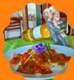
RAVIOLE MAXIMA RECHEADO COM BRIE E PRESUNTO TESSINES