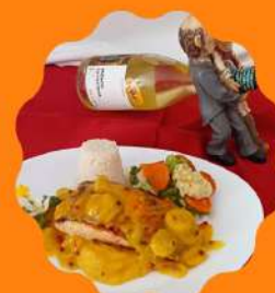
SALMÃO GRELHADO COM MOLHO DE LARANJA E PIMENTA ROSA