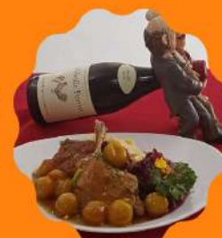
EEND (MARRCO) COM MOLHO DE KINCAN (MINI LARANJA) E REPOLHO ROXO CREMOSO COM VINHO TINTO E UVAS PASSAS

Horário de funcionamento Segunda a quinta feira das 11:30 às 15:30