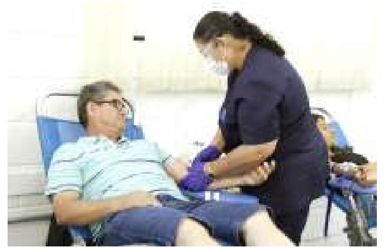
dades Médicas fica na Rua I da UniFAJ, no Jardim Amazonas, 504, Campus Dom Bosco.