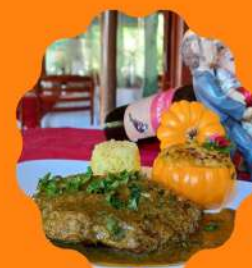
RENDERSCHENKEL (OSSO-BUCO) COZIMENTO SOUS-VIDE COM POMPOENPOT