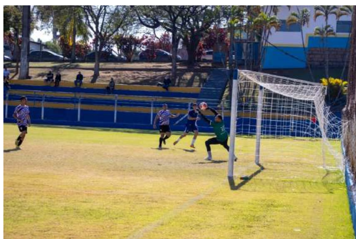
O Campeonato Amador de Futebol

– Amadorzão 2025 segue movimentando os campos de Jaguariúna. Neste fim de semana, dias 2 e 3 de agosto, serão realizados oito jogos válidos pela 6ª rodada da Taça Prata, com partidas nos campos do Azulão e Altino Amaral (Roseira de Cima).