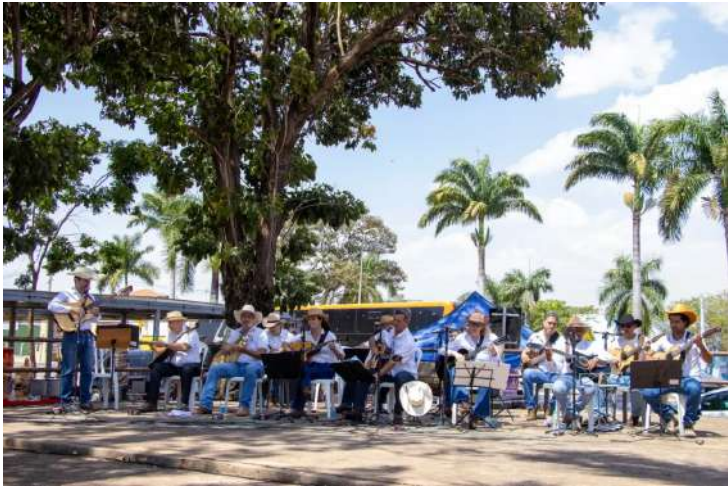
A tradicional Feira de Arte e Artesanato de Jaguariúna (Feart) completou

na última sexta-feira, dia 19 de setembro, 20 anos de história e para celebrar a data foi cumprida uma programação especial com a apresentação do Grupo Som Brasil, no sábado, e a Orquestra de Violeiros do Jaguar, domingo.