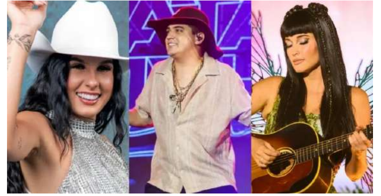
Park, com acesso de cadastro facial realizado por meio

Os ingressos seguem à venda online e também nas bilheteiras do Red