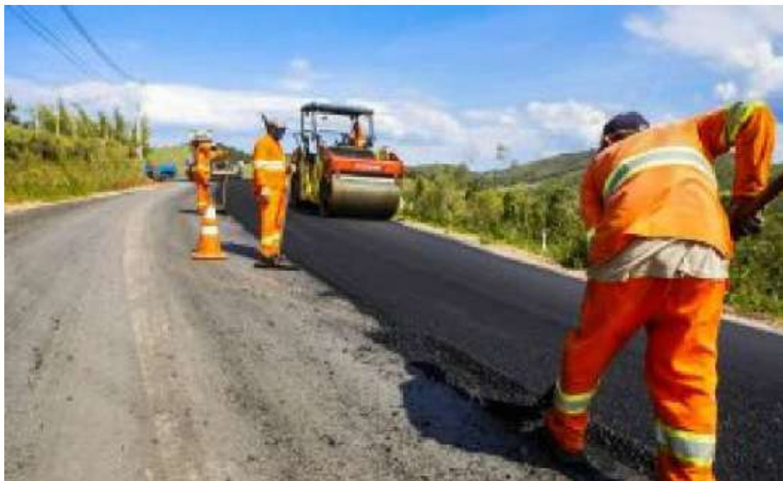
O pacote de obras inclui duplicação e alçamento da pista e implantação de viadutos e passagens de pedestres ao longo de três quilômetros SP 324

Investimento estimado para pacote de obras na SP 324 é de R$ 135 milhões; serviços incluem implantação de viadutos e acesso a Viracopos