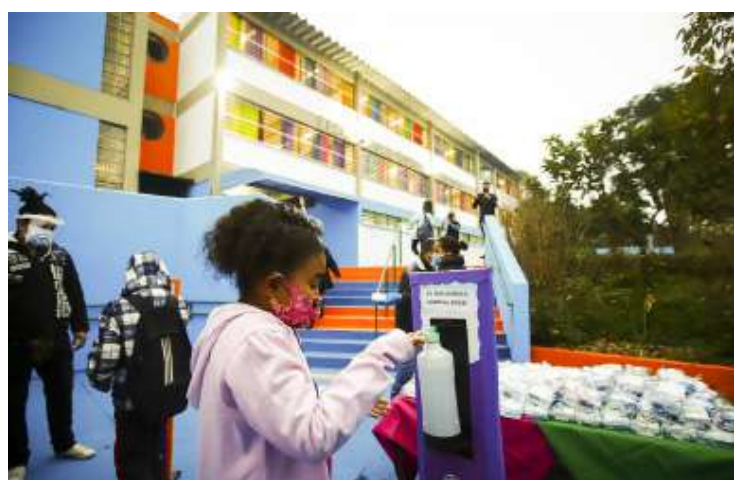
A nova fase é marcada pela ampliação da capacidade de atendimento das escolas, tendo como base as recomendações da Organização Mundial da Saúde

Atividades em municípios onde não há autorização para funcionamento das escolas seguem pelo Centro de Mídias SP