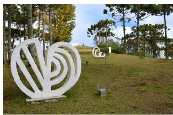
O museu está aberto para visita presencial de terça-feira a domingo, das 9h às 18h

Vale lembrar que o museu está aberto para visita presencial de terça-feira a domingo, das 9h às 18h, com 80% da capacidade. A medida acontece pela inserção do Estado de São Paulo à fase de transição do Plano SP, que possibilita o retorno seguro e gradativo das atividades presenciais, seguindo todos os protocolos de segurança sanitária para seus funcionários e visitantes. Todas as atividades estarão disponíveis nas mídias sociais (Facebook