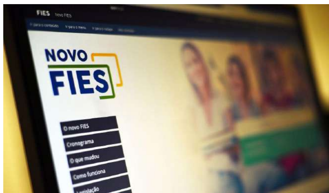
O Fies é o programa do governo federal que tem o objetivo de facilitar o acesso ao crédito para financiamento de cursos de ensino superior oferecidos por instituições privadas aderentes ao programa

O Fies é o programa do governo federal que tem o objetivo de facilitar o acesso ao crédito para financiamento de cursos de ensino superior oferecidos por instituições privadas aderentes ao programa. Criado em 1999, ele é ofertado em duas modalidades desde 2018, por meio do Fies e do Programa de Financiamento Es-