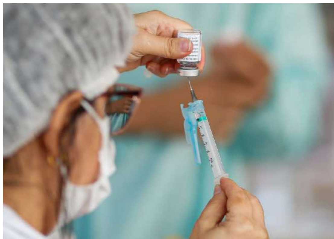
A meta é concluir esta etapa até 16 de agosto

8 a cada 10 pessoas acima de 18 anos já receberam pelo menos uma dose; meta é concluir a campanha até 16 de agosto