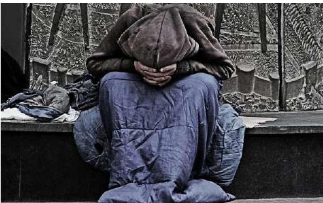
Os outros moradores, que estavam em situação de risco, já haviam decidido receber apoio e foram encaminhados para instituições assistenciais ou voltaram para junto da família

De todas as pessoas abordadas, apenas um homem ainda resistia e não queria receber nenhum tipo de apoio