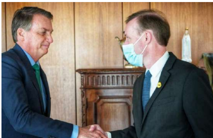
Presidente Jair Bolsonaro encontra o conselheiro de Segurança Nacional dos Estados Unidos, Jake Sullivan, nesta quinta-feira (5).

Jake Sullivan é o primeiro representante da Casa Branca de Joe Biden a se reunir com o presidente Jair Bolsonaro. Conselheiro também se encontra com ministros do governo brasileiro nesta quinta (5).