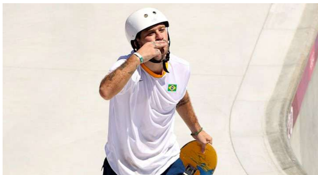
Com outras três medalhas garantidas, o Brasil no mínimo igualará a marca de 19 pódios da Rio 2016

com duas quedas nas eliminatórias, mas na última volta encaixou todas as manobras e tirou 79.02.