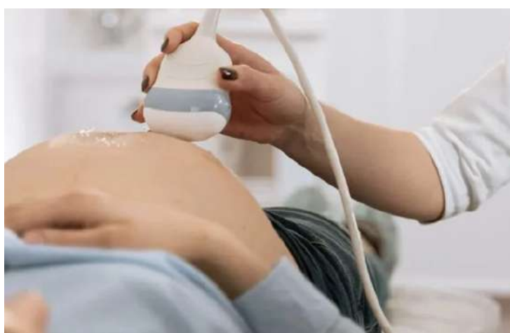
Outras atividades estão sendo programadas para acontecer durante o encontro, como forma de acolher todas as mães que estarão presentes

O encontro terá a palestra com profissionais da saúde