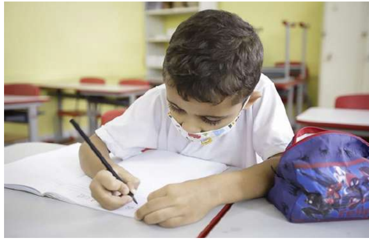
Os inscritos passarão agora para a segunda fase da seleção

Os inscritos passarão agora para a segunda fase da seleção, quando