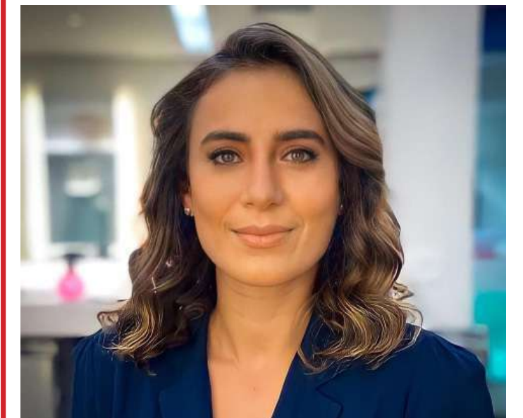
(Lana Canepa, do 'Jornal da Band'/Instagram)

todos. Há o desejo de dar um salto também na questão dos figurinos.