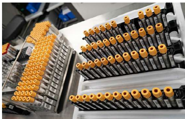
Cada ciclo vai durar quatro dias e envolverá a coleta de sangue dos voluntários

Um estudo dentro do estudo vai ampliar os conhecimentos da ciência sobre a imunidade gerada pelas vacinas no combate à Covid-19