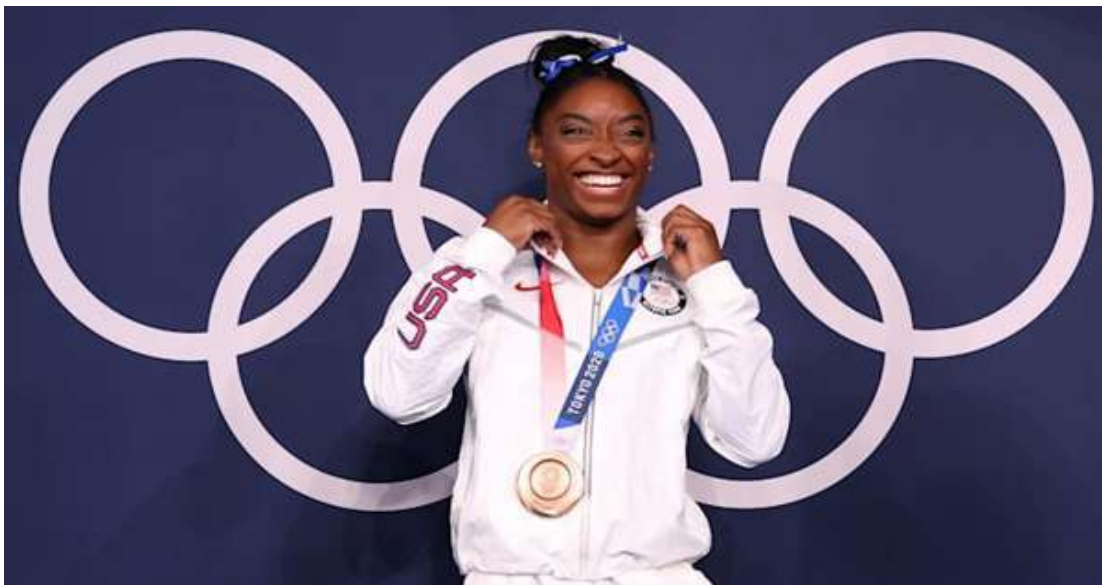
Simone Biles

Com a chama Olímpica apagada na Cerimônia de Encerramento na noite de domingo, os Jogos Olímpicos Tóquio 2020 oficialmente chegaram ao fim. E que Jogos! Tantos exemplos incríveis de coragem e habilidade; de espírito esportivo e emoção que espelham o novo lema Olímpico: “Mais rápido, mais alto, mais forte - juntos.”