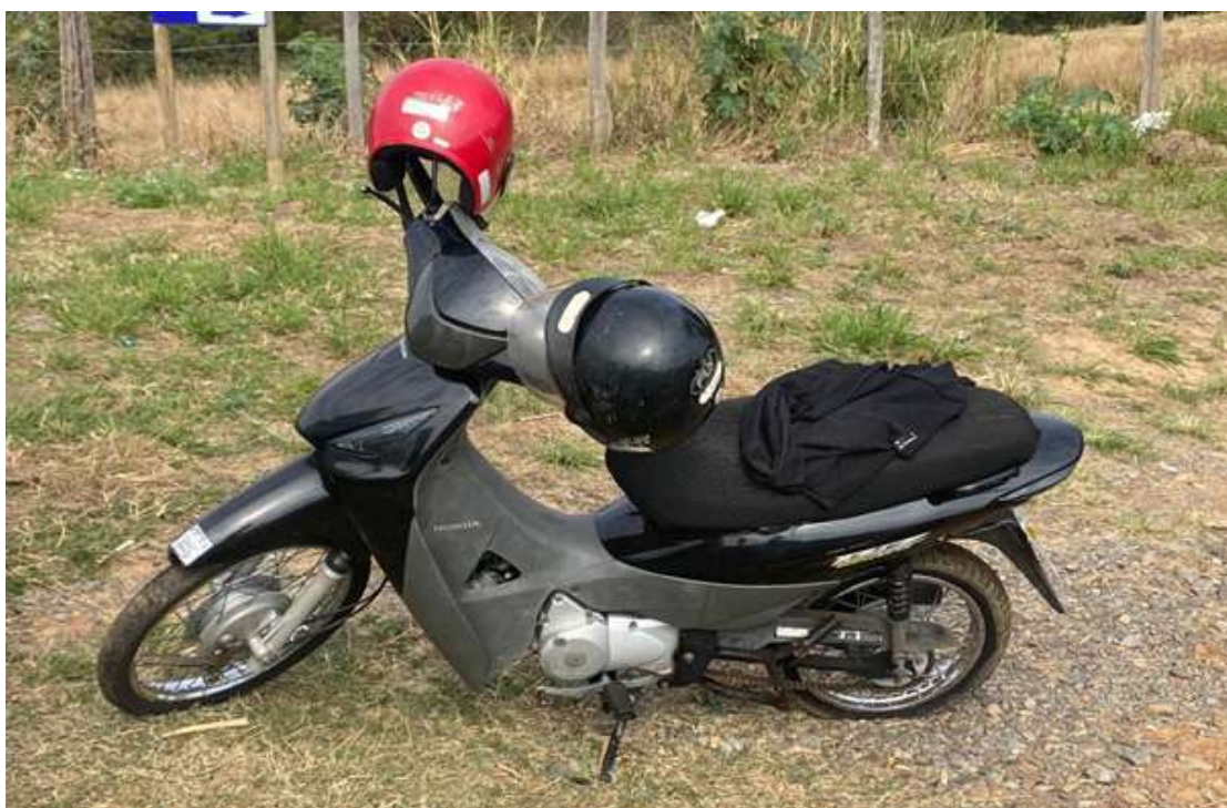
A Polícia Rodoviária Estadual esteve no local e registrou a ocorrência

Homem foi socorrido e não corre risco de morte