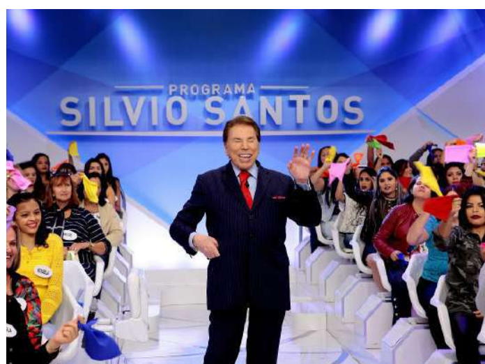
(imagem Silvio Santos)

No fim dos anos 1980, no seu programa do domingo, quadro dos calouros, Silvio Santos disse que ninguém sai de casa para o trabalho querendo errar. Todos vão querendo acertar. Mas em algumas vezes acabam errando.