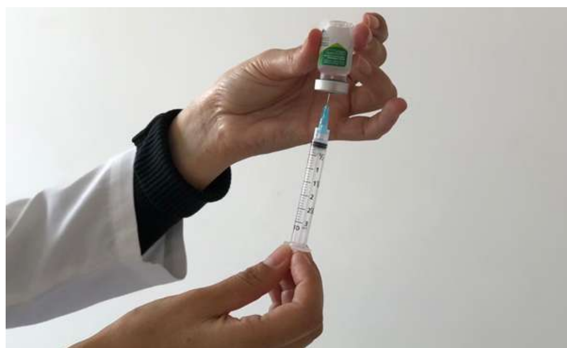
Na sexta-feira (13), entre as 8h e 17h, acontece a vacinação para as pessoas que ainda não tomaram a segunda dose de uma das vacinas disponíveis