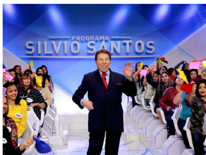
(imagem Silvio Santos)

No fim dos anos 1980, no seu programa do domingo, quadro dos calouros, Silvio Santos disse que ninguém sai de casa para o trabalho querendo errar. Todos vão querendo acertar. Mas em algumas vezes acabam errando.