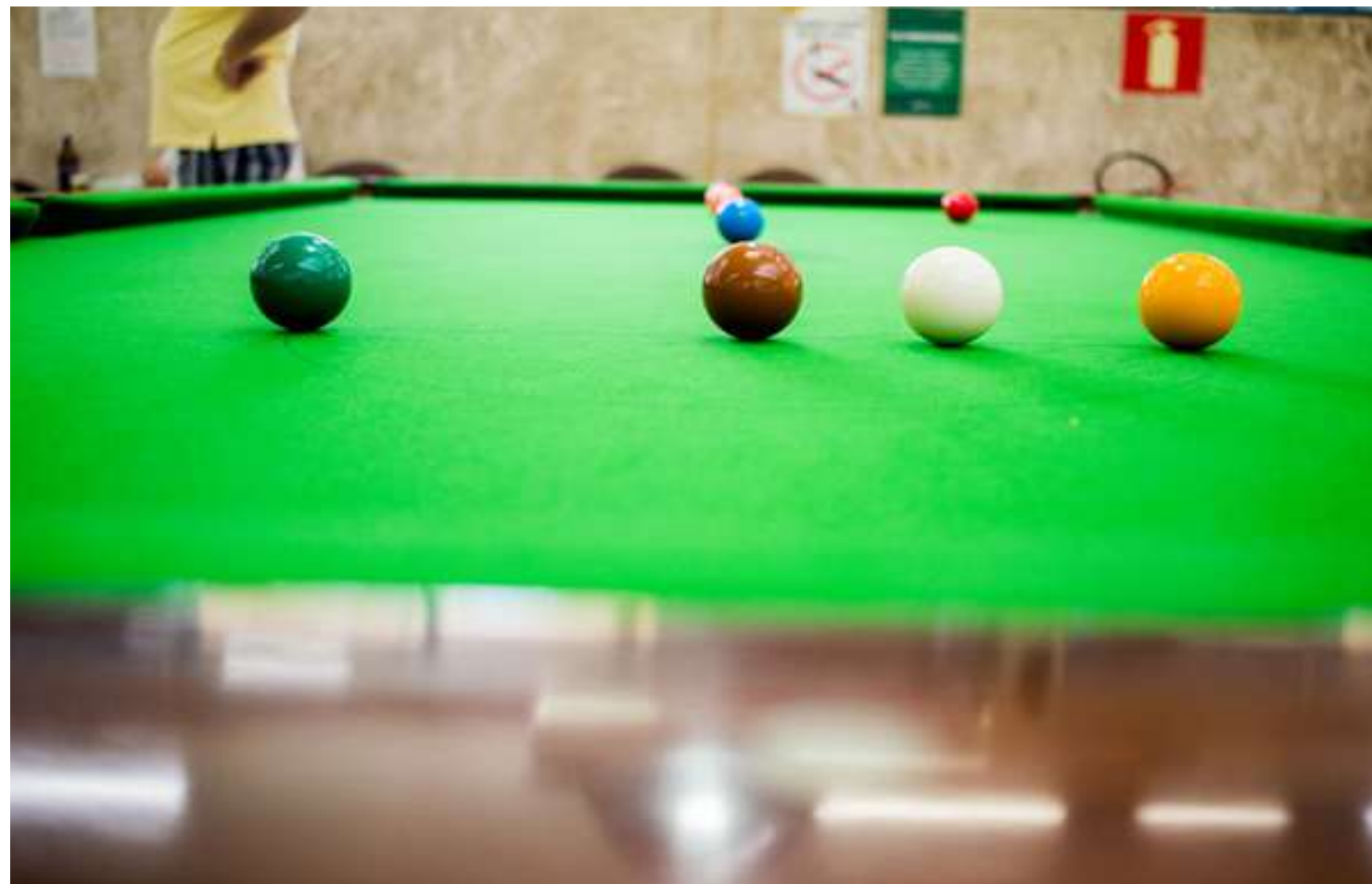
Torneio de Sinuca vai pagar mil reais em prêmio