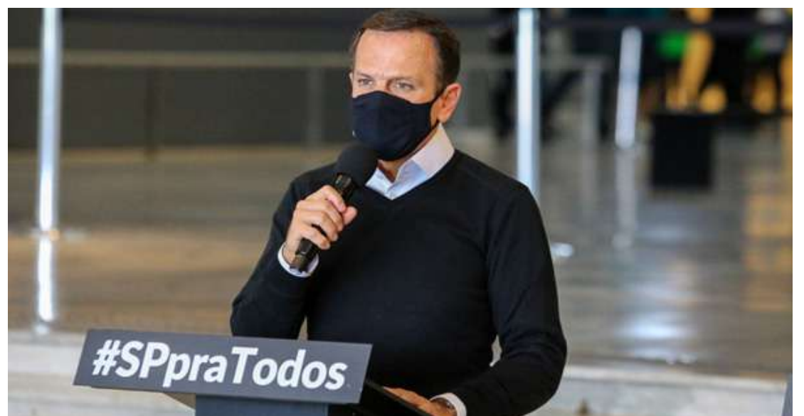
O Governador João Doria confirmou, nesta quarta-feira (8), que não foram registradas intercorrências com as doses da Coronavac presentes nos lotes suspensos pela Agência Nacional de Vigilância Sanitária (Anvisa).

A Secretaria de Estado da Saúde também orientou os municípios quanto ao monitoramento por 30 dias de todas as pessoas que