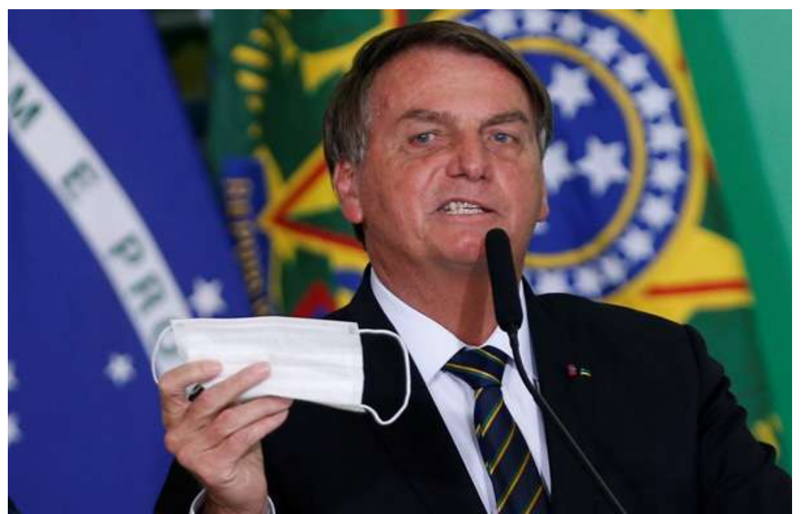
De novo! Governo de SP multa Bolsonaro por não usar máscara.

A terceira reincidência ocorreu em 31 de julho,