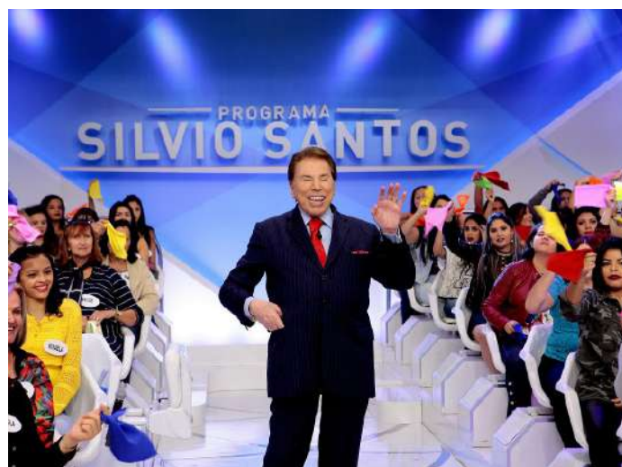
(imagem Silvio Santos)

No fim dos anos 1980, no seu programa do domingo, quadro dos calouros, Silvio Santos disse que ninguém sai de casa para o trabalho querendo errar. Todos vão querendo acertar. Mas em algumas vezes acabam errando.