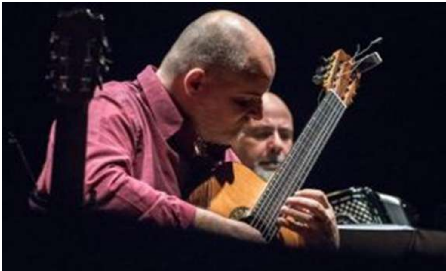
Torneio de Sinuca vai pagar mil reais em prêmio

A obra traduz para o violão, canções do acordeonista e compositor Toninho Ferragutti. “A parceria com a Gravadora Experimental foi muito importante para viabilizar esse disco, que foi feito por meio de financiamento coletivo”, ressalta Siqueira. “Possibilitou a gravação com um nível de qualidade muito