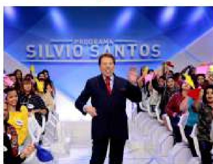
Imagem Silvio Santos

No fim de semana, novos programas do domínio, quando os apresentadores de uma parte e também quando não, estão se preparando para o começo de uma nova temporada. Mas que apresentadores podem esperar.