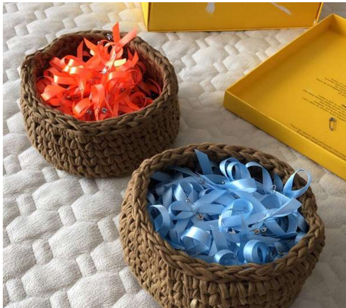
Noivos Raquel e João escolheram laranja como cor mais restritiva e azul com mais permissiva. Convidados escolhem qual interação se sentem mais confortáveis — Foto: Arquivo pessoal