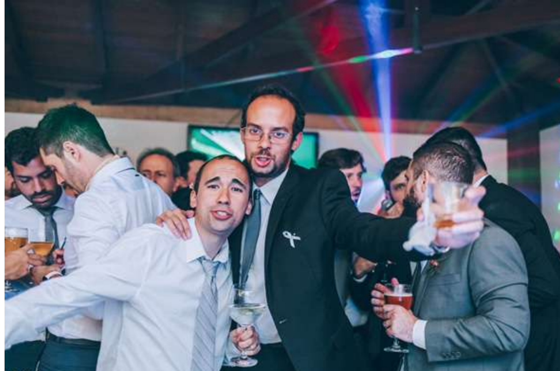
Em festa de casamento no interior de São Paulo, convidado usou fitinha azul, o que indicava que estava confortável para interagir com abraços

"A vermelha é realmente 'vim aqui prestigiar mas não estou confortável, não me abraça', já o amarelo é 'estou médio confortável, me pergunta antes de me abraçar', e o azul é para quem já está bem 'estou aqui, vou curtir', contou a noiva. Fernanda trocou o verde pelo azul por ser a cor predominante da decoração