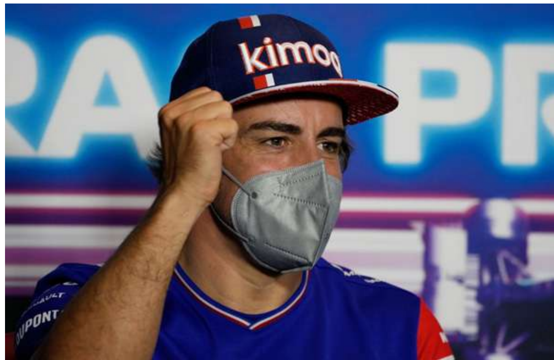
Fernando Alonso, da Alpine, no GP da Itália

- O domínio da Mercedes foi brutal nos primeiros três ou quatro anos da era V6. E aí a partir de 2017, quando a F1 introduziu pneus maiores e carros mais largos, acho que foi um passo para trás em termos de conseguir seguir de perto o carro da frente e produzir boas corridas. Faltam elementos do passado, mas a F1 aprendeu com essas experiências e acho que teremos uma melhor temporada em