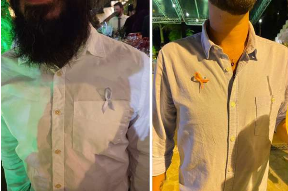
Em casamento, fitinha azul demonstrava que a pessoa estava aberta para um abraço. Já a laranja advertia: apenas um singelo cumprimento

'A vermelha é não estou confortável, não me abraça', já o amarelo é 'estou médio confortável, me pergunta antes', e o [verde] azul é para quem já está bem 'vou curtir', contou uma noiva. Outra noiva também fez 'vacinômetro dos convidados'.