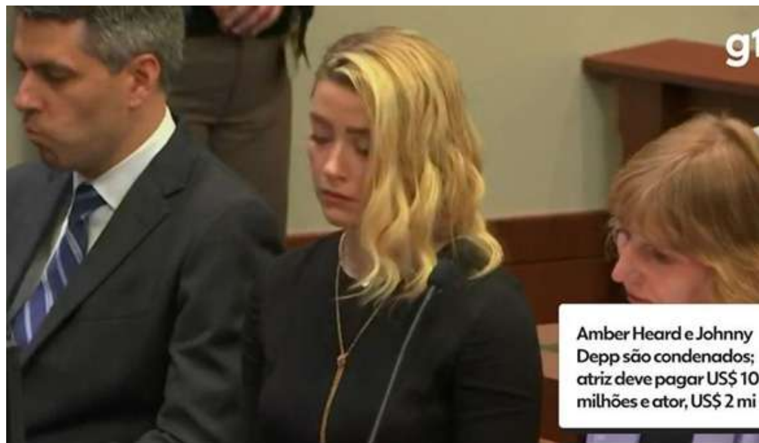
Amber Heard e Johnny Depp são condenados; atriz deve pagar US$ 10 milhões e ator, US$ 2 mi

1. "Amber Heard e seus amigos na mídia usam alegações falsas de violência sexual como espada e escudo, dependendo de suas necessidades. Eles selecionaram alguns de seus 'fatos' de fraude de violência sexual como a espada, infligindo-os ao público e ao Sr. Depp" (8 de abril de 2020) - O júri