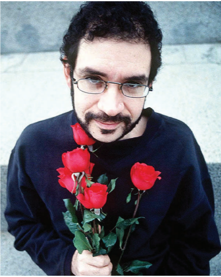
Imagem promocional da caixa 'Obra & arte', com discos de Renato Russo

Com a revalorização do CD como formato de mídia física, tendência sutil já ob-