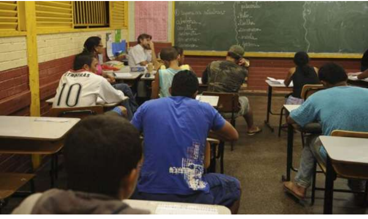
Moradores de Engenheiro Coelho que não

Exame afere competências, habilidades e saberes de jovens e adultos que não concluíram o ensino fundamental ou médio na idade adequada. Saiba como fazer a prova