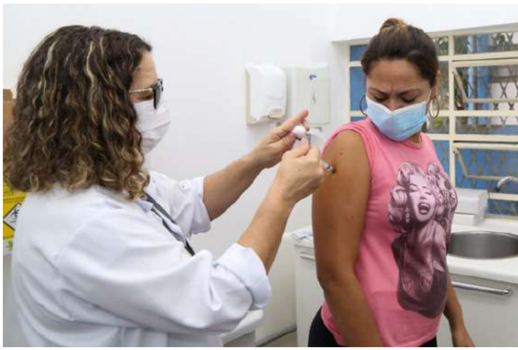
A Secretária Municipal de Saúde de Engenheiro Coelho iniciou a aplicação da vacina

meningocócica C para profissionais de saúde. A vacinação faz parte de uma iniciativa do ministério da saúde de ampliar a cobertura vacinal e evitar a circulação da doença no país.