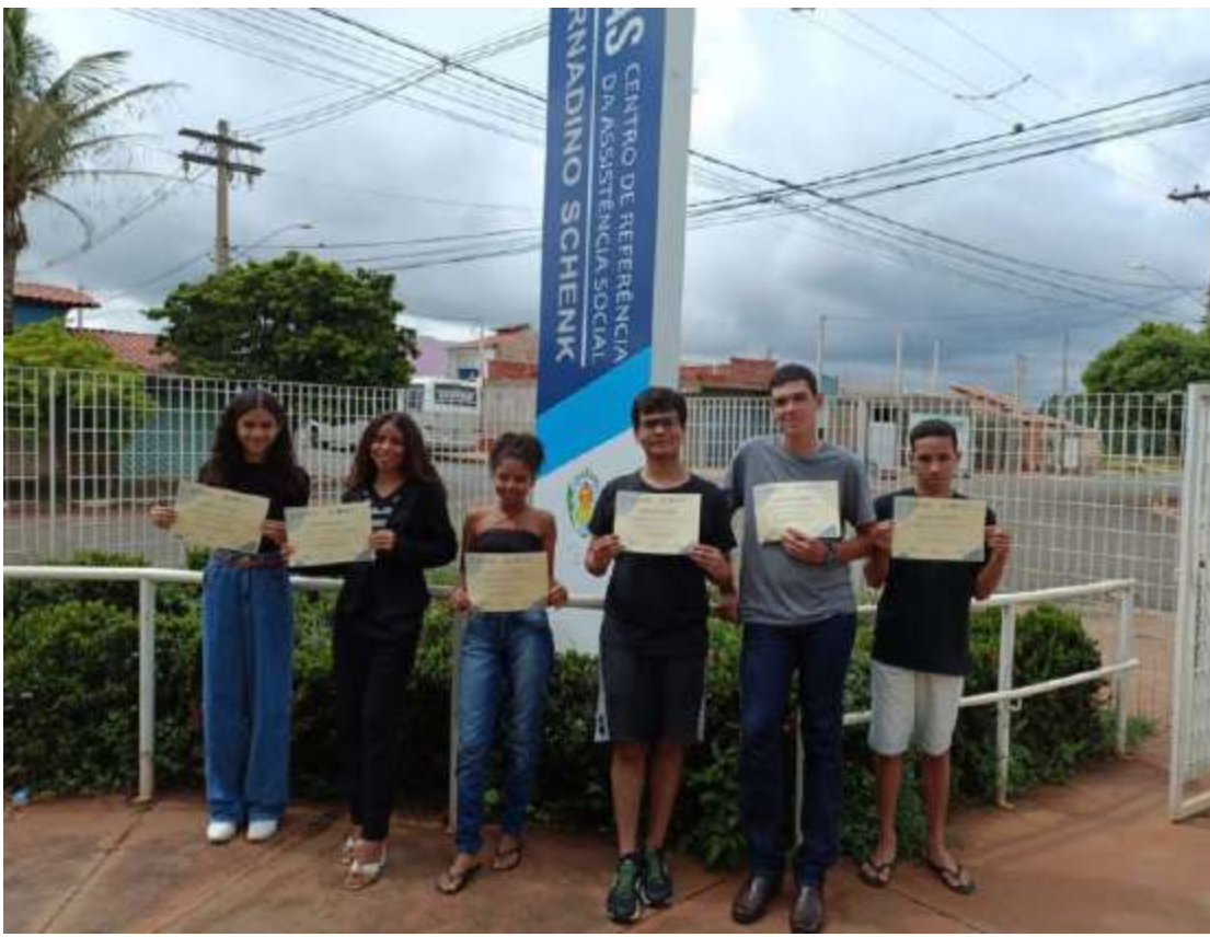
Os alunos das oficinas ofertadas pelo Centro da Referência da Assistência Social (CRAS), receberam os certificados de conclusão na última