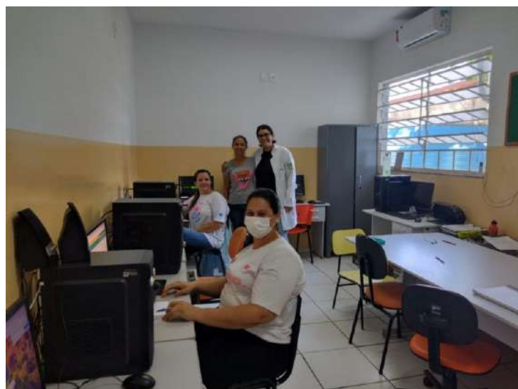
A campanha Março Lilás 2023 terminou!