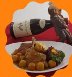
EEND (MARRECO) COM MOLHO DE KINCAN (MINI LARANJA) E REPOLHO ROXO CREMOSO COM VINHO TINTO E UVAS PASSAS

Horário de funcionamento Segunda a quinta feira das 11:30 às 15:30 Sexta feira a domingo e feriados das 11:30 às 16:00 hrs