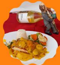
SALMÃO GRELHADO COM MOLHO DE LARANJA E PIMENTA ROSA.