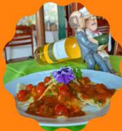
RAVIOLE MAXIMA RECHEADO COM BRIE E PRESUNTO TESSINES