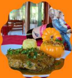
RENDERSCHENKEL (OSSO-BUCO COZIMENTO SOUS-VIDE) COM POMPOENPOT.

Venha conhecer nosso cardápio especial do Dia do Rei!