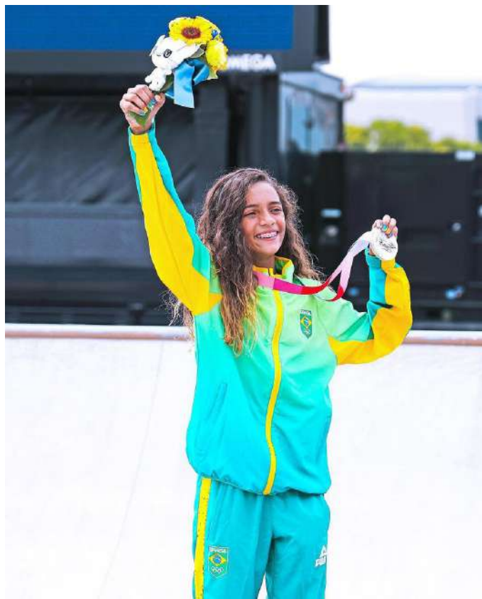
(Rayssa Leal, medalha de prata nos Jogos Olímpicos)

Mesmo com um ano de atraso, a pandemia ainda muito presente e fuso horário de 12 horas para o Brasil, a Olimpíada do Japão é um grande sucesso.