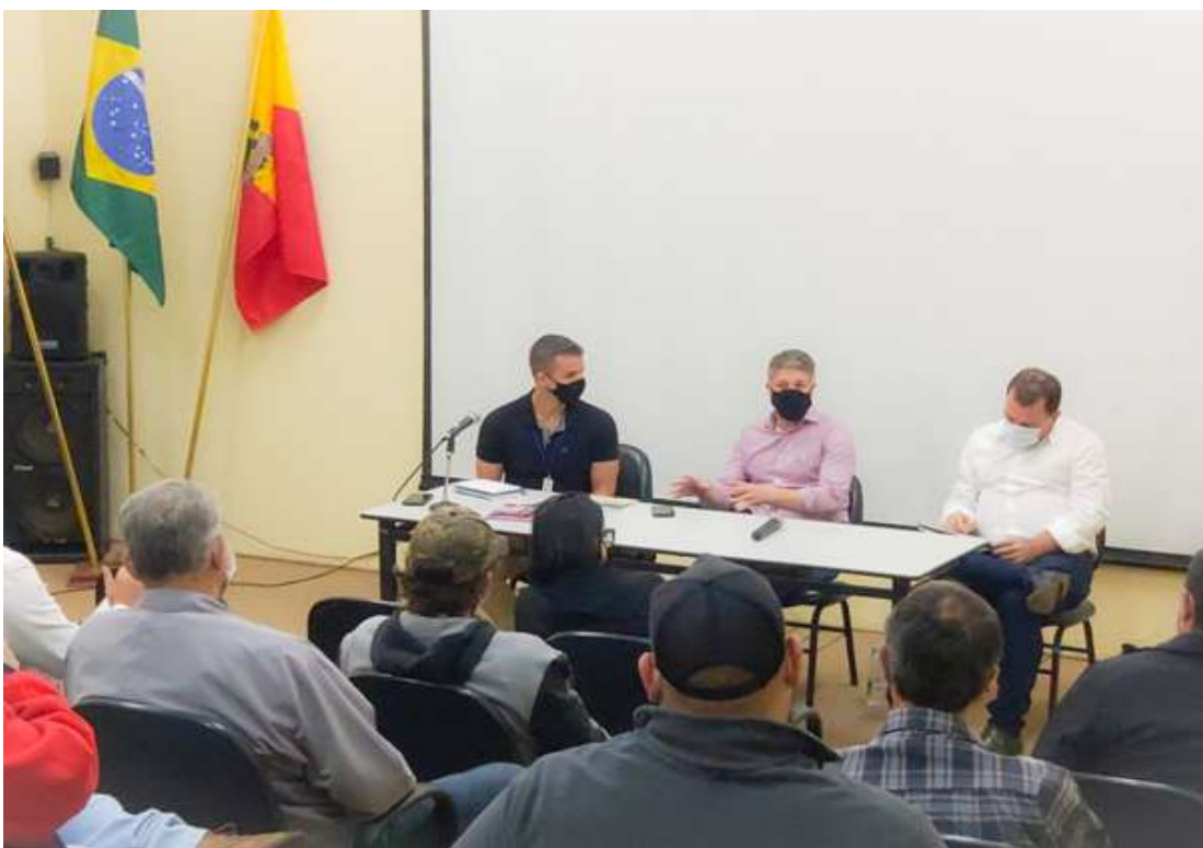
Prefeito ressaltou ainda que muitas pessoas não conhecem os pontos históricos e de lazer de Mogi Guaçu

Primeira de uma série de encontros contou com a presença de secretários municipais e representantes da iniciativa privada