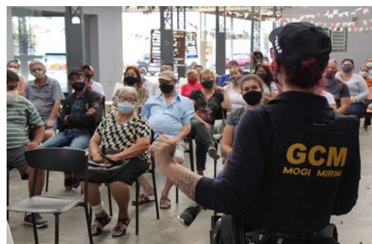
A iniciativa ainda contou com o apoio da Secretaria de Segurança Pública e da coordenadora da patrulha, a GCMF

Desde que foi criada, em março deste ano, a patrulha “Maria da Penha” já atendeu a dezenas de ocorrências no Município, resultando, inclusive, na prisão de agressores ou ex-companheiros que descumpriram medidas protetivas. A unidade especial também está servindo de modelo para outras GCMs da região, como Estiva Gerbi e Mogi Guaçu.