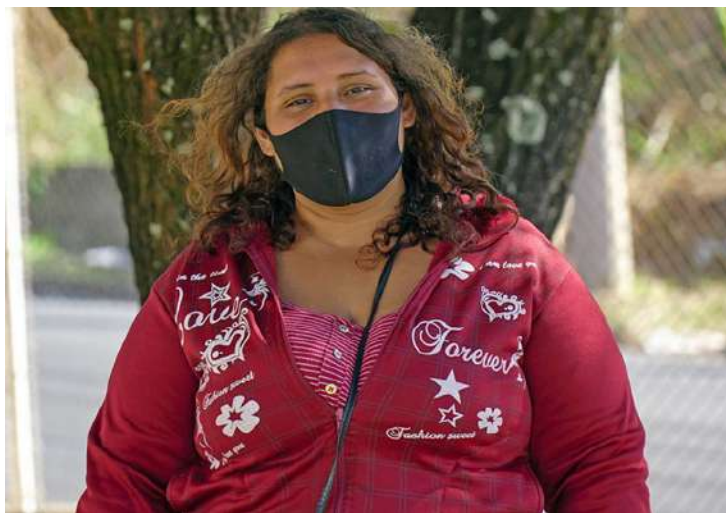
O Renda Guaçuana já beneficia 4.144 núcleos familiares da cidade

Subsídio de R$ 150 mensais está sendo concedido pela Prefeitura pelo período de 90 dias para reduzir os impactos financeiros