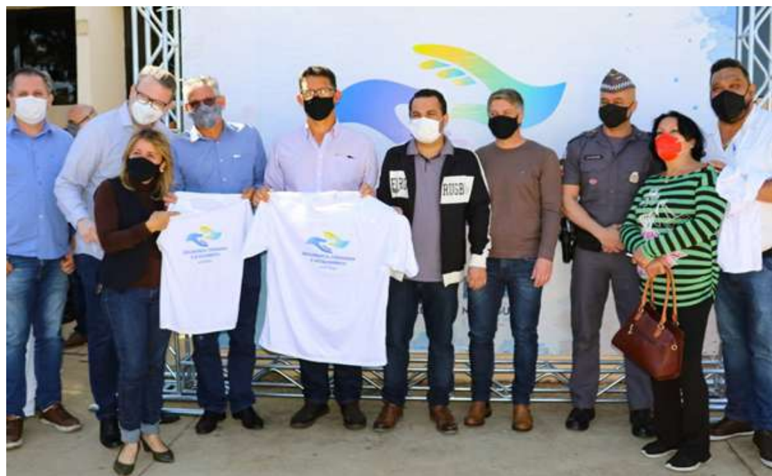
O programa já promoveu a saída de 3 indivíduos destas condições

O objetivo da iniciativa é fortalecer serviços já existentes, do poder público e entidades