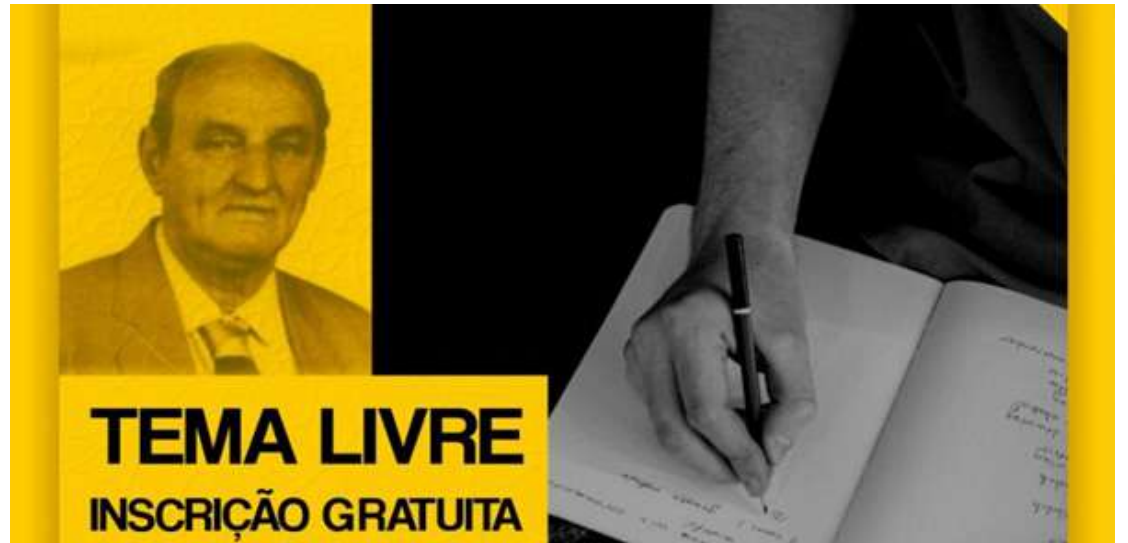
De acordo com o cronograma, o campeonato começa neste sábado