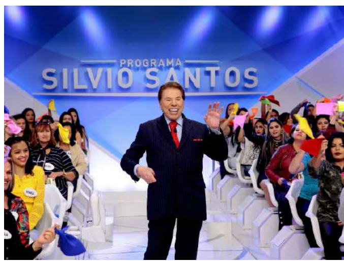
(imagem Silvio Santos)

No fim dos anos 1980, no seu programa do domingo, quadro dos calouros, Silvio Santos disse que ninguém sai de casa para o trabalho querendo errar. Todos vão querendo acertar. Mas em algumas vezes acabam errando.