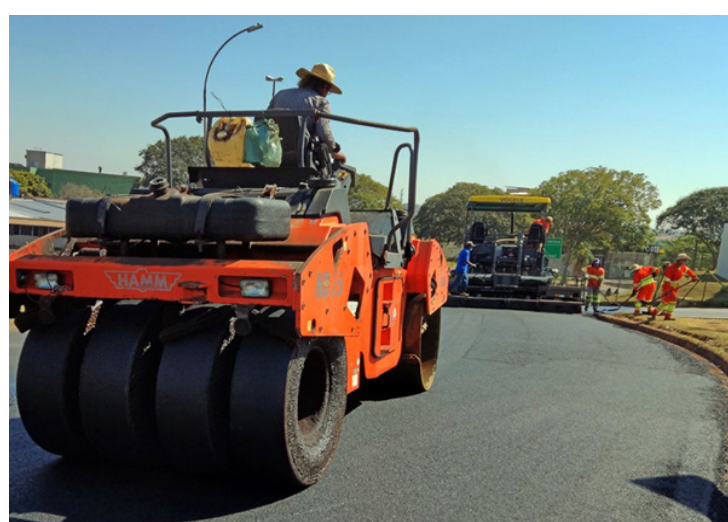
trada Municipal Nagib Matte Merhej - além da duplicação da Avenida Brasil, importante via de acesso à cidade. Foram recapeados trechos da Avenida Clara Lanzi Bueno, na Vila Leila, da Rua José Penteado, no

tenas de pontos da cidade seria um dos grandes desafios da nossa administração. E temos procurado atacar esse problema de frente, investindo forte em melhorias desde o início do ano e buscando novos investimentos junto ao Estado e ao Governo Federal para darmos sequência ao longo do próximo ano”, destacou o prefeito Rodrigo Falsetti, que acompanhou de perto os trabalhos na rotatória do HMTR na manhã do dia 6. Ao longo dos primeiros oito meses do ano, a Prefeitura levou asfalto à Avenida Gabriela Caruso Soares, no Distrito Industrial João Batista Caruso, e a trecho da Es-