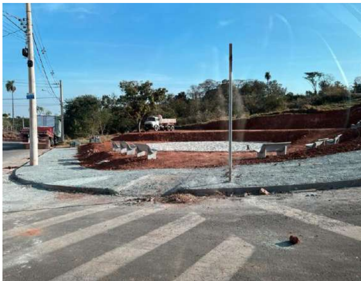
A Prefeitura Municipal de Santo Antônio de Posse foi contemplada com a perfuração de

mais dois novos poços artesianos, com intuito de ampliar a oferta de água para a população. Além dos poços, estão sendo instalados dois reservatórios com capacidade de armazenamento de 100 mil litros, um próximo a Guarda Municipal e o outro na ETA (Estação de Tratamento de Água) da Saudade, para ajudar a abastecer os bairros Jardim Progresso, Vila Rica e Becari.