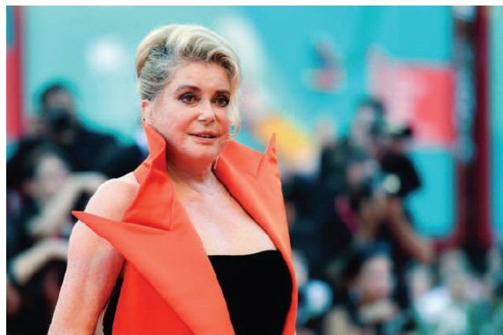
Catherine Deneuve no tapete vermelho da cerimônia de abertura do Festival de Veneza de 2019

A estrela do cinema francês Catherine De-