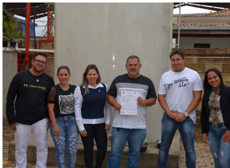
A Câmara Municipal de Santo Antônio de Posse obteve o laudo do Auto de Vistoria

do Corpo de Bombeiros (AVCB) do prédio da sede do Poder Legislativo.