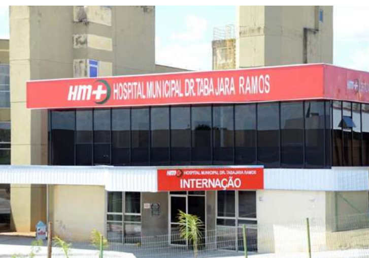
O Hospital Municipal Dr. Tabajara Ramos

(HMTR) agendou para os dias 22, 23 e 24 de julho um mutirão de cirurgias oftalmológicas, sendo a maioria de catarata. Os procedimentos serão feitos no centro cirúrgico da unidade, que passou recentemente por reforma e melhorias. Nessa etapa, 225 pacientes serão operados. “As cirurgias serão feitas no Hospital e vamos atender pacientes que já passaram