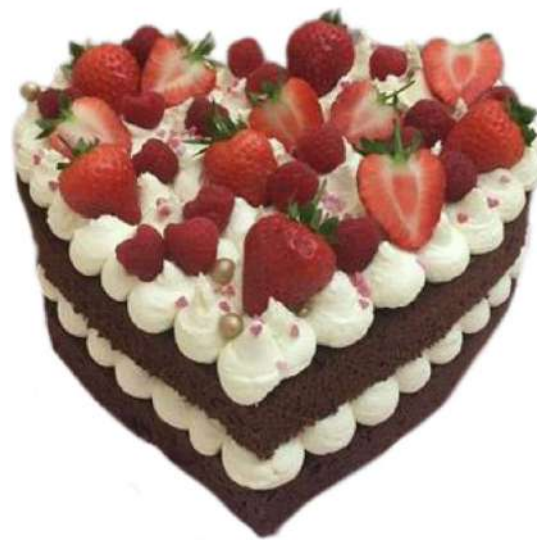
Coração de Brownie com creme de baunilha trufado