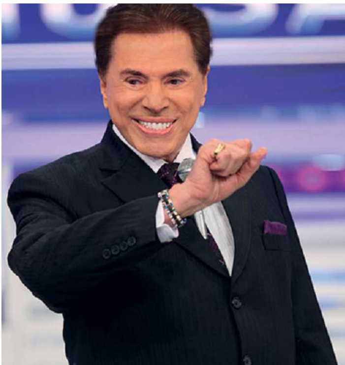
(Imagem : Silvio Santos)

Silvio Santos, mais de ano, ensaiou zilhões de vezes voltar a gravar o seu programa e sempre acabou desistindo na última hora.