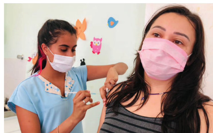
recomendado para esta faixa etária pela Agência Nacional de Vigilância Sanitária (Anvisa).

Em Artur Nogueira, até esta quinta-feira (16), 2.660 adolescentes haviam se vacinado com a 1ª dose da Pfizer, único imunizante