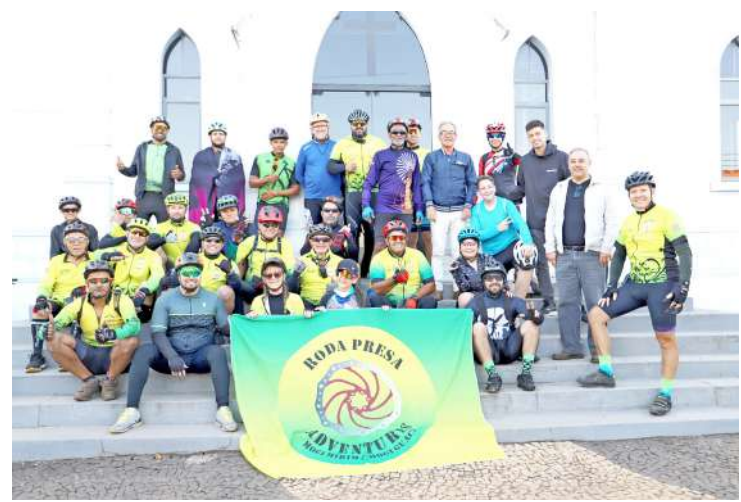
Amparo, Jaguariúna, Americana, Vargem Grande do Sul, Limeira e Jundiá, além de Mogi Mirim.