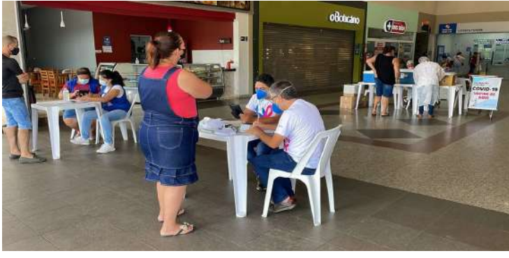
A Prefeitura de Artur Nogueira, por meio da secretaria de Saúde, promoverá mais um Dia V

de vacinação neste sábado, dia 19 de fevereiro, das 8h às 15h. A ação é voltada para todas as faixas etárias, inclusive crianças a partir dos 5 anos.