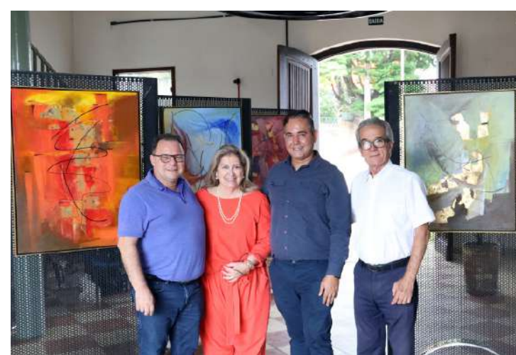
telas ficarão expostas na Estação Educação até a próxima quarta-feira, dia 29.