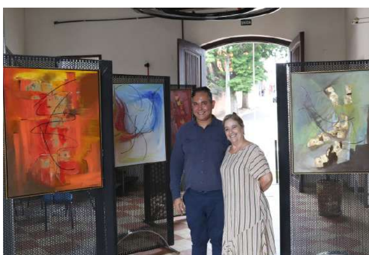
Tereza de Jesus Paiva, onde o artista ministra aula de artes, para conhecer a exposição. As