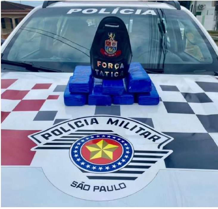
Equipe de Força Tática frustra tentativa de transporte ilegal, resultando na detenção de indivíduos e apreensão de substâncias ilícitas