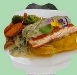
SALMÃO PRIMAVERA COM PURÊ DE MANDIOQUINHA E MOLHO ESPECIAL