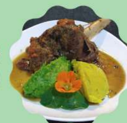
LAMBBOUL À MODA TRATTORIA

Horário de funcionamento Segunda a quinta feira das 11:30 às 15:30 Sexta feira a domingo e feriados das 11:30 às 16:00 hrs