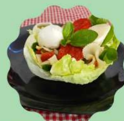
CONCHA DE ALFACE AMERICANA COM FARFALE, PALMITO, TOMATE SECO E MIX DE LEGUMES

Venha conhecer nosso cardápio especial da Primavera!