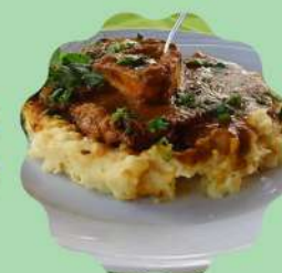
SCHENKEL: OSSOBUCO À SOUS-VIDE E PURÊ DE BATATA