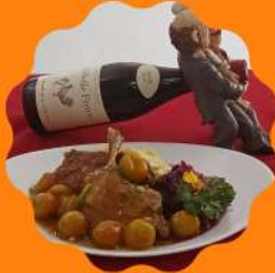
EEND (MARRECO) COM MOLHO DE KINCAN (MINI LARANJA) E REPOLHO ROXO CREMOSO COM VINHO TINTO E UVAS PASSAS

Horário de funcionamento Segunda a quinta feira das 11:30 às 15:30 Sexta feira a domingo e feriados das 11:30 às 16:00 hrs