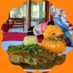
RENDERSCHENKEL (OSSO-BUCO COZIMENTO SOUS-VIDE) COM POMPOENPOT