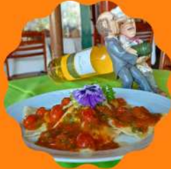
RAVIOLE MAXIMA RECHEADO COM BRIE E PRESUNTO TESSINES