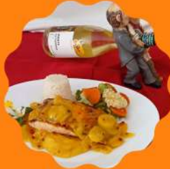
SALMÃO GRELHADO COM MOLHO DE LARANJA E PIMENTA ROSA