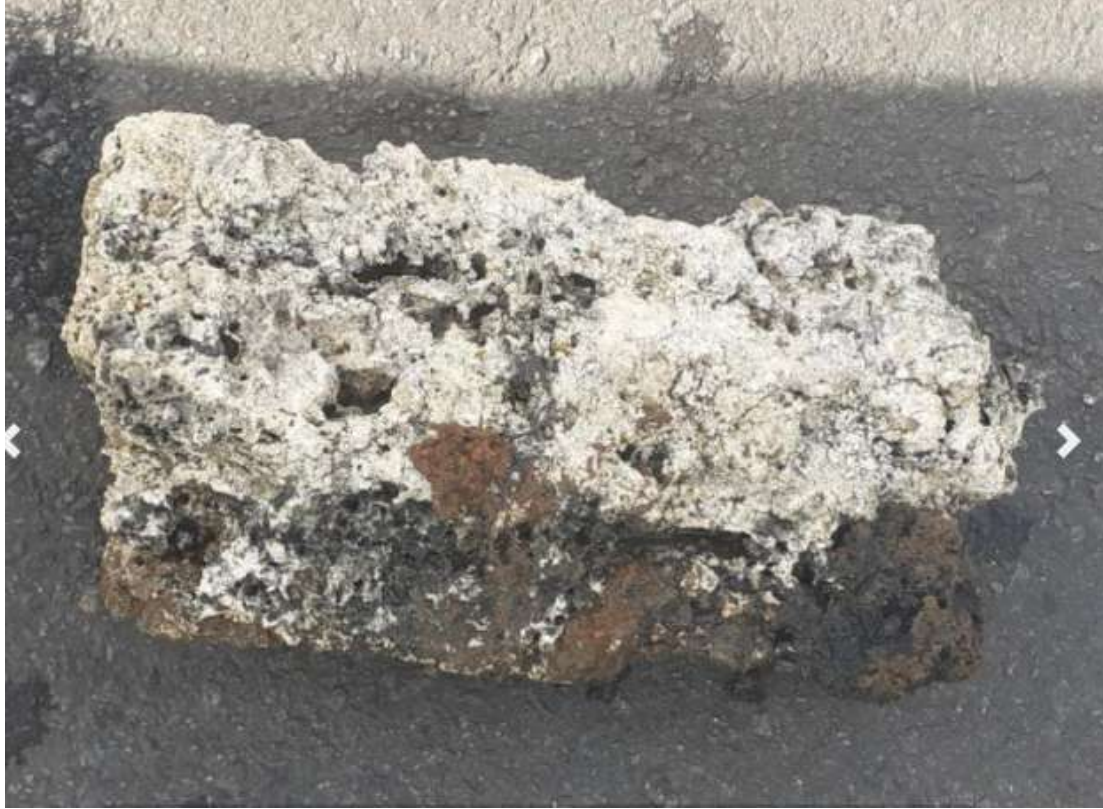
legenda: Óleo e gordura em geral, descartada na rede se solidifica e se transforma em uma massa dura como concreto

Óleo e gordura em geral, descartada na rede se solidifica e se transforma em uma massa dura como concreto