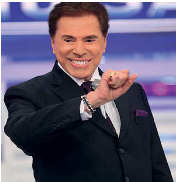
(Imagem: Silvio Santos)

Silvio Santos, mais de ano, ensaiou zilhões de vezes voltar a gravar o seu programa e sempre acabou desistindo na última hora.