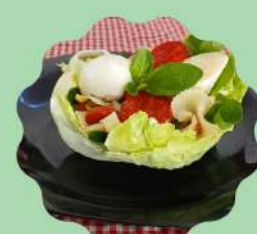
CONCHA DE ALFACE AMERICANA COM FARFALE, PALMITO, TOMATE SECO E MIX DE LEGUMES

Venha conhecer nosso cardápio especial da Primavera!