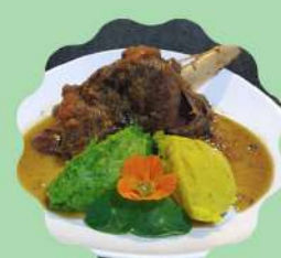
LAMBOUT À MODA TRATTORIA

Horário de funcionamento Segunda a quinta feira das 11:30 às 15:30 Sexta feira a domingo e feriados das 11:30 às 16:00 hrs