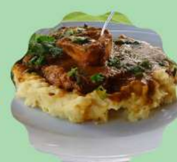
SCHINKEL: OSSOBUCO À SOUS-VIDE E PURÊ DE BATATA