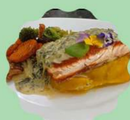
SALMÃO PRIMAVERA COM PURÊ DE MANDIOQUINHA E MOLHO ESPECIAL