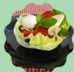
CONCHA DE ALFACE AMERICANA COM FARFALLE, PALMITO, TOMATE SECO E MIX DE LEGUMES

Venha conhecer nosso cardápio especial da Primavera!