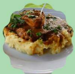
SCHENKEL: OSSOBUCO À SOUS-VIDE E PURÊ DE BATATA