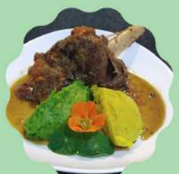
LAMSBOUT À MODA TRATTORIA

Horário de funcionamento Segunda a quinta feira das 11:30 às 15:30