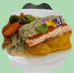
SALMÃO PRIMAVERA COM PURÊ DE MANDIOQUINHA E MOLHO ESPECIAL