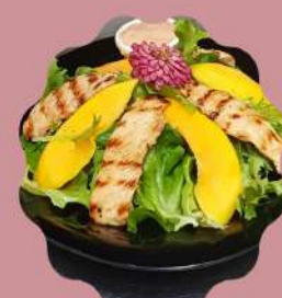
SALADA VAN GOGH MIX DE FOLHAS COM LASCAS DE MANGA E FILE DE FRANGO GRELHADO