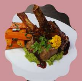
COSTELINHA SUÍNA PIRULITO MOLHO ORIENTAL

Horário de funcionamento Segunda a quinta feira das 11:30 às 15:30 Sexta feira a domingo e feriados das 11:30 às 16:00 hrs