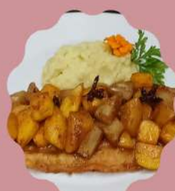
LINGUADO PICASSO COM FRUTAS ABACAXI, PÊSSEGO E MANGA