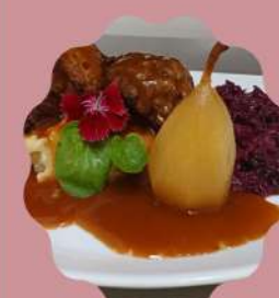
BLINDE VINK BIFE DE ALCATRA ENROLADA COM CARNE MOIDA TEMPERADAS COM ESPECIARIAS E MOLHO RÓTI