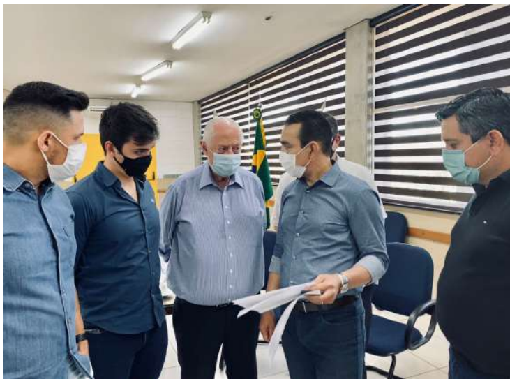
Legenda: Promessa de campanha beneficiará centenas de moradores e pessoas que utilizam a via