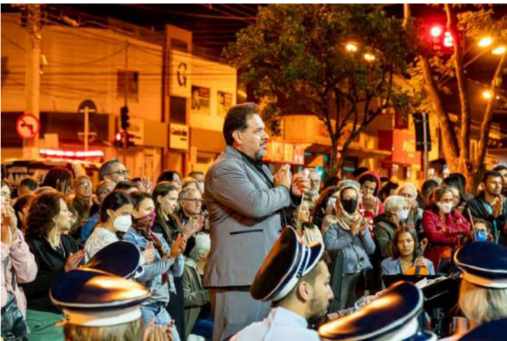
De Artur Nogueira

A Corporação Musical 24 de Junho comemorou o aniversário de 98 anos neste domingo, (26) na Praça do Coreto, em Artur Nogueira. O espetáculo 'Pra ver a Banda Passar' foi gratuito e contou com o apoio da Prefeitura de