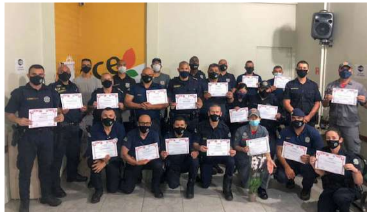
Policiais Municipais de Holambra, Artur Nogueira, Mogi Mirim, Jaguariúna e Cos-