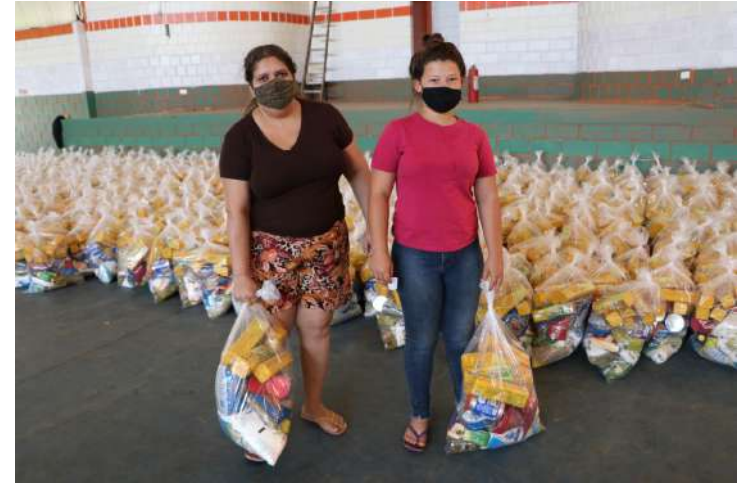
alunos da Educação de Jovens e Adultos (EJA), como uma maneira de proporcionar um complemento nutricional”, explica.

O prefeito Fernando Capato reforça que os produtos distribuídos servem como um complemento à alimentação oferecida aos estudantes nas unidades de ensino. “A merenda voltou a ser servida em todas as escolas e creches. Mas seguimos distribuindo o kit para as crianças do berçário ao 9º ano do ensino fundamental, e também aos