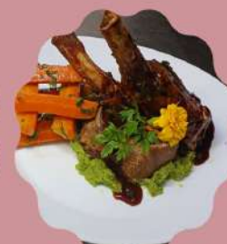
COSTELINHA SUÍNA PIRULITO MOLHO ORIENTAL

Horário de funcionamento Segunda a quinta feira das 11:30 às 15:30 Sexta feira a domingo e feriados das 11:30 às 16:00 hrs