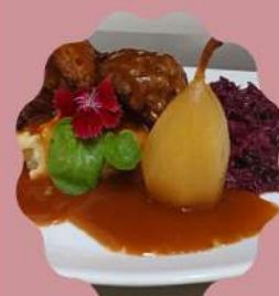
BLINDE VINK BIFE DE ALCATRA ENROLADA COM CARNE MOIDA TEMPERADAS COM ESPECIARIAS E MOLHO RÓTI