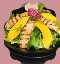
SALADA VAN GOGH MIX DE FOLHAS COM LASCAS DE MANGA E FILE DE FRANGO GRELHADO