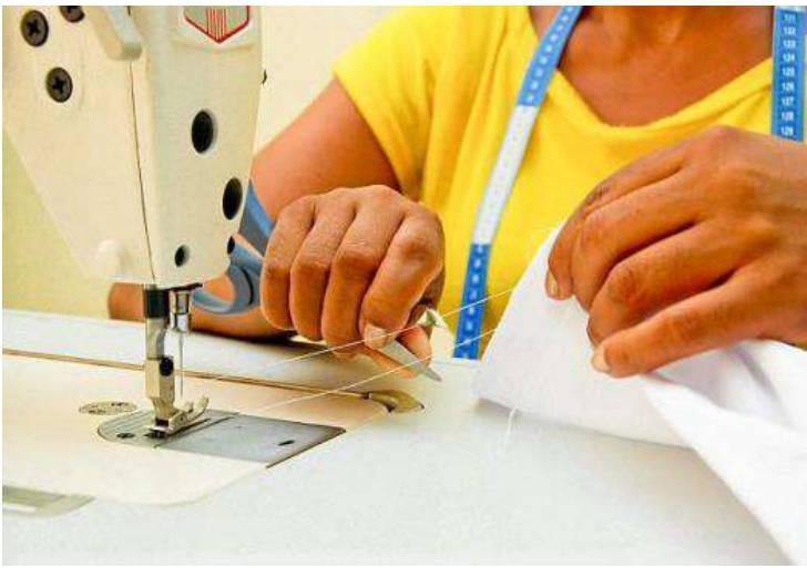
A Prefeitura de Artur Nogueira, por meio da Secretaria de Assistência Social e do Fundo Social

de Solidariedade, divulga vagas para o curso gratuito de Costureiro e Costureiro Avançado (Corte e Costura). A capacitação é uma parceria entre o Executivo Municipal e o Governo do Estado de São Paulo, através do Programa Escola de Qualificação Profissional.