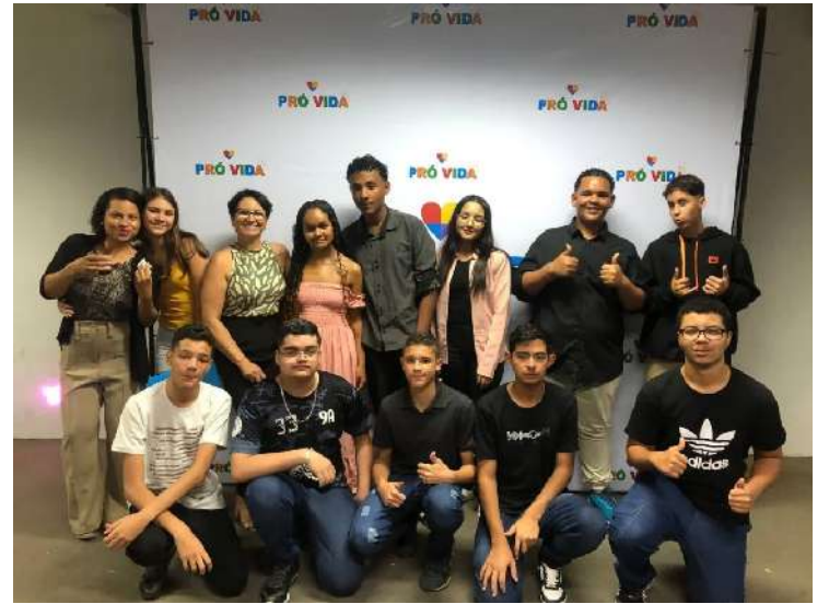
do bem-estar da comunidade.

A Associação Pró-Vida continua seu compromisso com a educação e a capacitação de jovens em Santo Antônio de Posse, reafirmando seu papel vital na promoção do desenvolvimento e