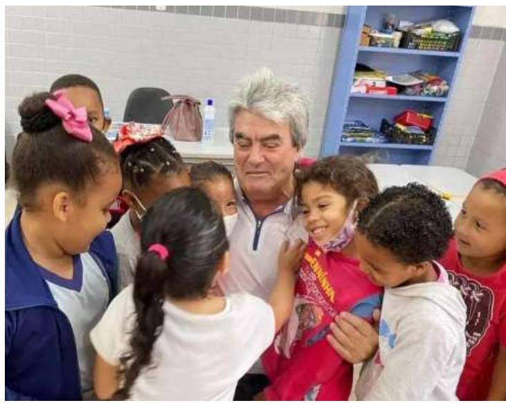
As escolas da rede pública municipal de Santo Antônio de Posse estão sendo equipa-

das com aparelhos de ar condicionado nas salas de aula e passando por reformas, que incluem desde pintura a reparos nas instalações. Quatro creches também estão se encontram em obras para reforma e ampliação, resultando na criação de mais 240 vagas e praticamente zerando a fila por vagas. De acordo com a prefeitura, a educação está entre as áreas da administração municipal que mais recebeu melhorias e investimentos nos últimos quatro anos com o objetivo de melhorar ainda mais a quali-