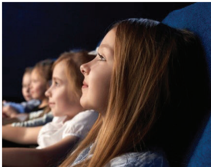
A Biblioteca José Maria Homem de Montes irá receber três sessões gratuitas de cinema ao longo

Elas ocorrem sempre às 19h por meio do Pontos MIS, programa do Museu da Imagem e do Som