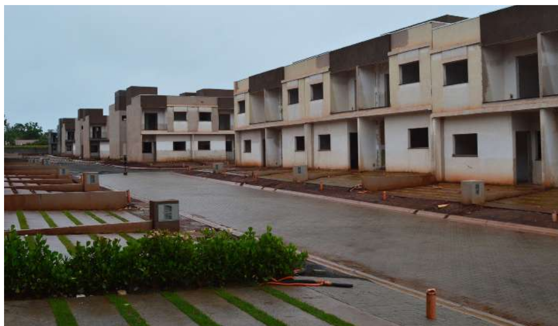
Residencial Ipê Amarelo, com conclusão e entrega prevista para dezembro deste ano, já encontra-se 70% concluído

Com a proposta de oferecer tranquilidade, conforto, requinte, sofisticação e o melhor investimento para morar com toda a família, em uma completa infraestrutura de segurança, lazer e entretenimento, a um preço bem acessível, o Residencial dos Ipês já é uma realidade para Artur Nogueira e região. No sábado, dia 29 de janeiro, o Grupo Pura, responsável pelo empreendimento, realizou o evento de lançamento do mais novo bairro planejado da cidade, além da abertura do decorado, reunindo futuros moradores, convidados e investidores.