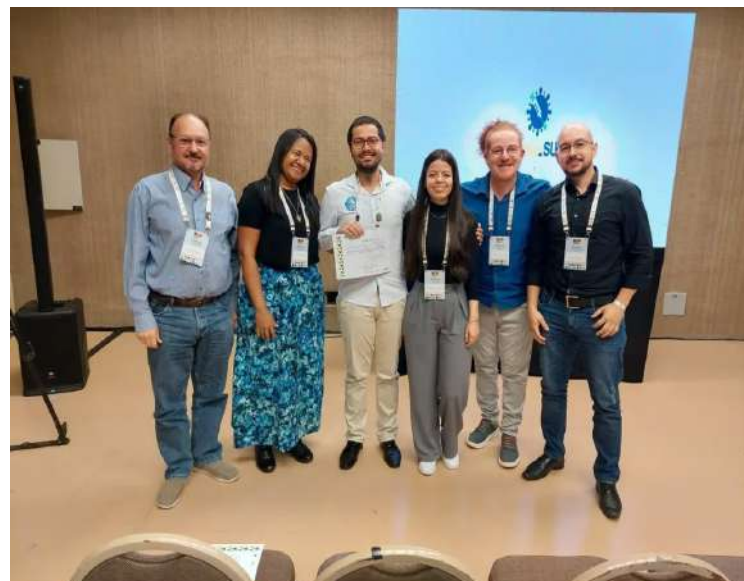
Conselhos de Secretários Municipais de Saúde do Estado de São Paulo (Cosems) do Brasil.