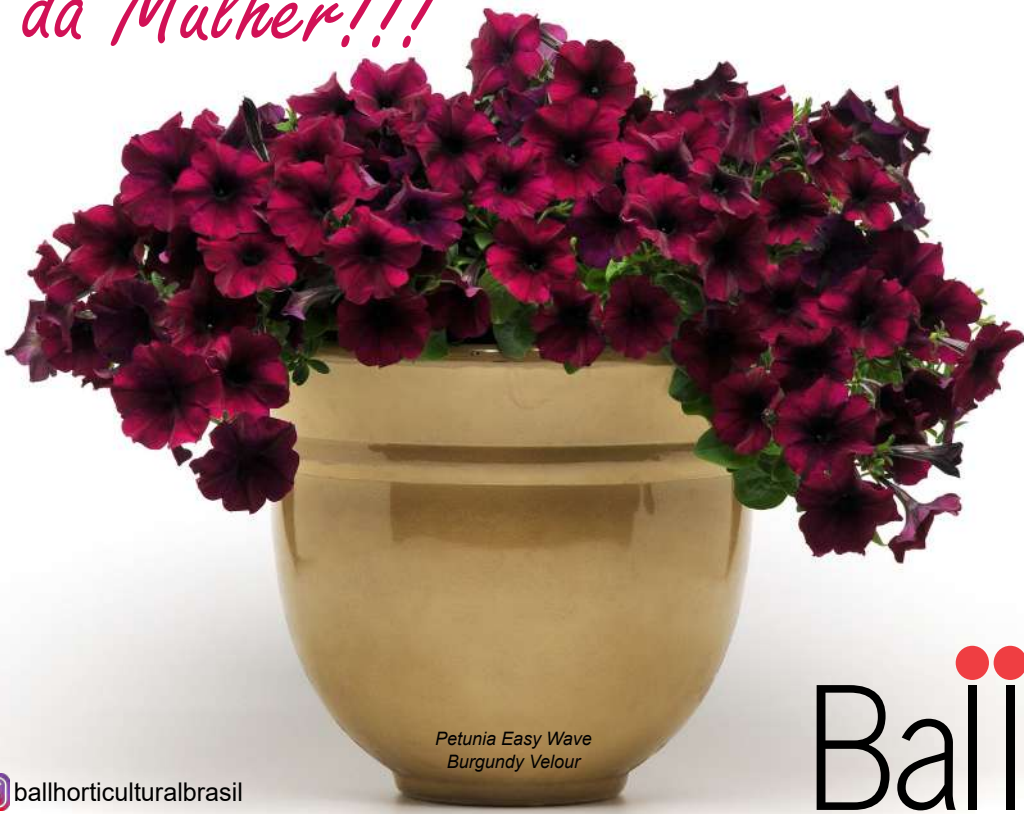
Petunia Easy Wave Burgundy Velour