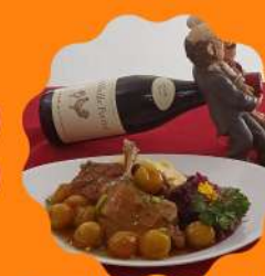
END (MARRECO) COM MOLHO DE KINKAN (MINI LARANJA) E REPOLHO ROXO CREMOSO COM VINHO TINTO E UVAS PASSAS

Horário de funcionamento Segunda a quinta feira das 11:30 às 15:30 Sexta feira a domingo e feriados das 11:30 às 16:00 hrs