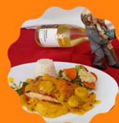
SALMÃO GRElhADO COM MOLHO DE LARANJA E PIMENTA ROSA