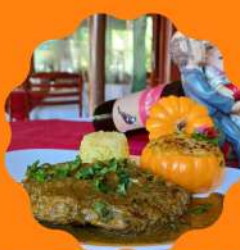
RENDSCHEKEL (OSSO-BUCO COZIMENTO SOUS-VIDE) COM POMPOENPOT