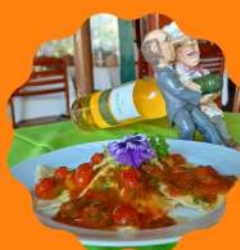
RAVIOLE MAXIMA RECHEADO COM BRIE E PRESUNTO TESSINES